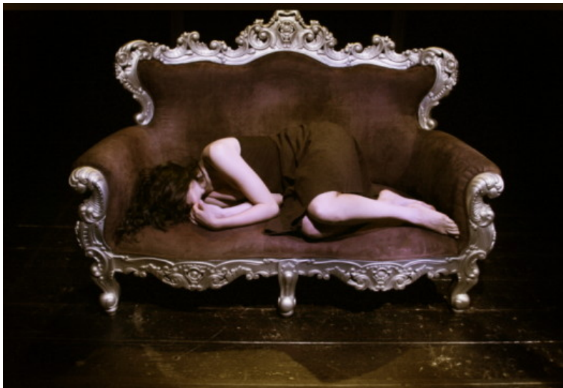
Dal 26 febbraio al 10 marzo al Teatro Libero di Milano va in scena MERCURIO